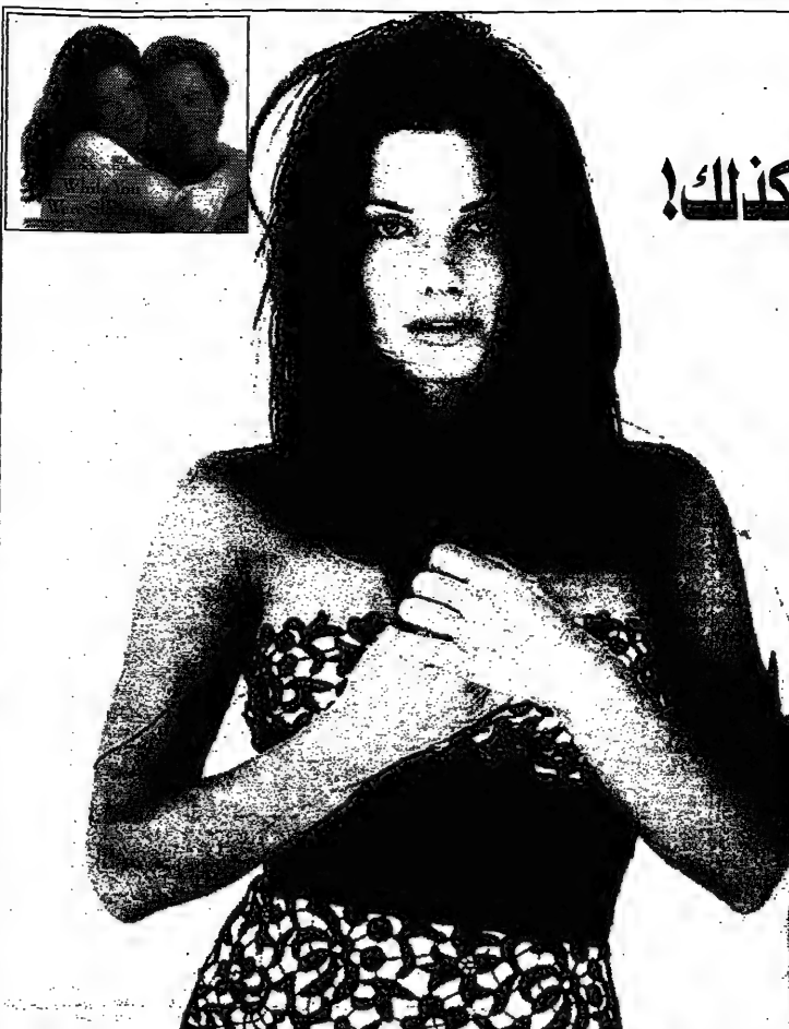
ساندرا بولوك في إطار برنامج الحداثة

ما هو الشيء الذي أتمنى أن يكون في حياتي؟... أنا فتاة بسيطة ولكنني لا أبودو كذلك!